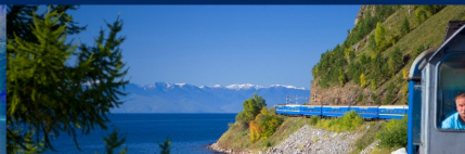
Trenes de Lujo