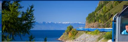
Trenes de Lujo