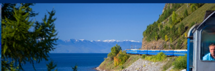
Trenes de Lujo